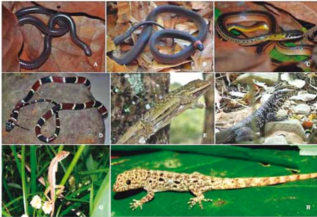
Figura 3. Especies de reptiles exclusivas de los tres hábitat evaluados, bosque (b), silvopastoril (s) y minería (m). A- Trilepida macrolepis (b), B- Ninia atrata (b), C- Erythrolamprus melanotus (b), D- Rhinobothryum bovallii (s), E- Thecadactylus rapicauda (b), F- Tupinambis teguixin (s), G- Anolis auratus (s) y H- Hemidactylus brookii (m).